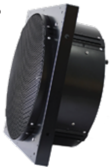
Mounting Frame Marco de montaje